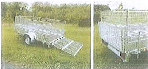
RE250 F130 avec rehausse grillagée de 50 cm, béquilles de stabilité arrière et rampe pliante 1,10 m galvanisée à chaud